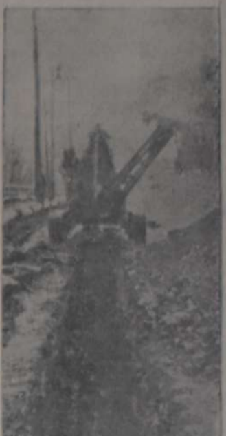
ZANJADORA DE GRUA QUE REALIZA EL TRABAJO DE MUCHOS HOMBRES

Las obras de saneamiento de una región no sólo deben corresponder a las cantidades de agua inmundas y lluvias de la región, deberían extenderse a desecar el subsuelo de la población si es que ésta es húmeda, y deberían abarcar en conjunto o separadamente la desecación de pantanos y terrenos fangosos vecinos a las grandes poblaciones. Los pantanos, las lagunas y los terrenos fangosos, como abrigaderos de moscos, son otros tantos peligros para la salubridad por ser el origen del paludismo y otras enfermedades mortíferas transmitidas por esos insectos. Las obras, pues, de saneamiento abarcan: Desecación del subsuelo; desecación y avenamiento de lagunas, pantanos o fangos; eliminación de aguas inmundas y dar salida a las aguas de lluvia, con las partes principales que debe comprender todo proyecto bien hecho de saneamiento de una localidad.