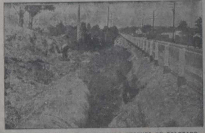
LA PALA MECANICA TERRAPLENANDO DESPUES DE COLOCADO EL TUBO DE PALASTRO

Las obras de saneamiento de una región no sólo deben corresponder a las cantidades de agua inmundas y lluvias de la región, deberían extenderse a desecar el subsuelo de la población si es que ésta es húmeda, y deberían abarcar en conjunto o separadamente la desecación de pantanos y terrenos fangosos vecinos a las grandes poblaciones. Los pantanos, las lagunas y los terrenos fangosos, como abrigaderos de moscos, son otros tantos peligros para la salubridad por ser el origen del paludismo y otras enfermedades mortíferas transmitidas por esos insectos. Las obras, pues, de saneamiento abarcan: Desecación del subsuelo; desecación y avenamiento de lagunas, pantanos o fangos; eliminación de aguas inmundas y dar salida a las aguas de lluvia, con las partes principales que debe comprender todo proyecto bien hecho de saneamiento de una localidad.