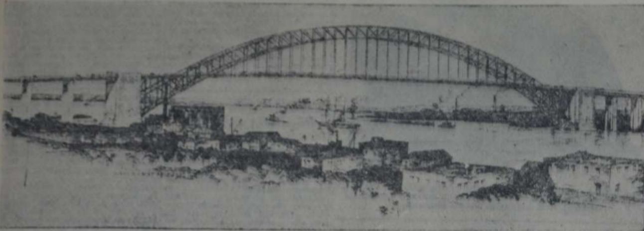
SOBRE EL RIO KILL VAN KULL, QUE SEPARA LOS ESTADOS DE NUEVA YORK Y NUEVA JERSEY, SE TENDERA EL PUENTE EN

En el Hell Gate, empleóse acero al carbón no obstante su mayor costo sobre el níquel (40 $ por tonelada). Para